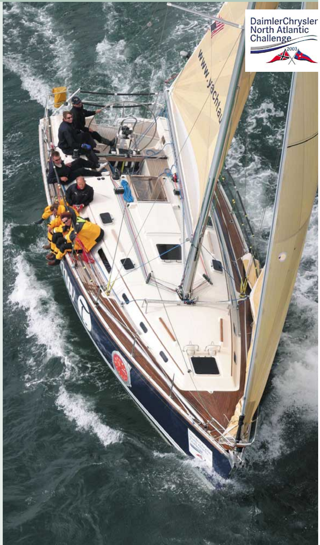
DaimlerChrysler North Atlantic Challenge Tom's Kahn